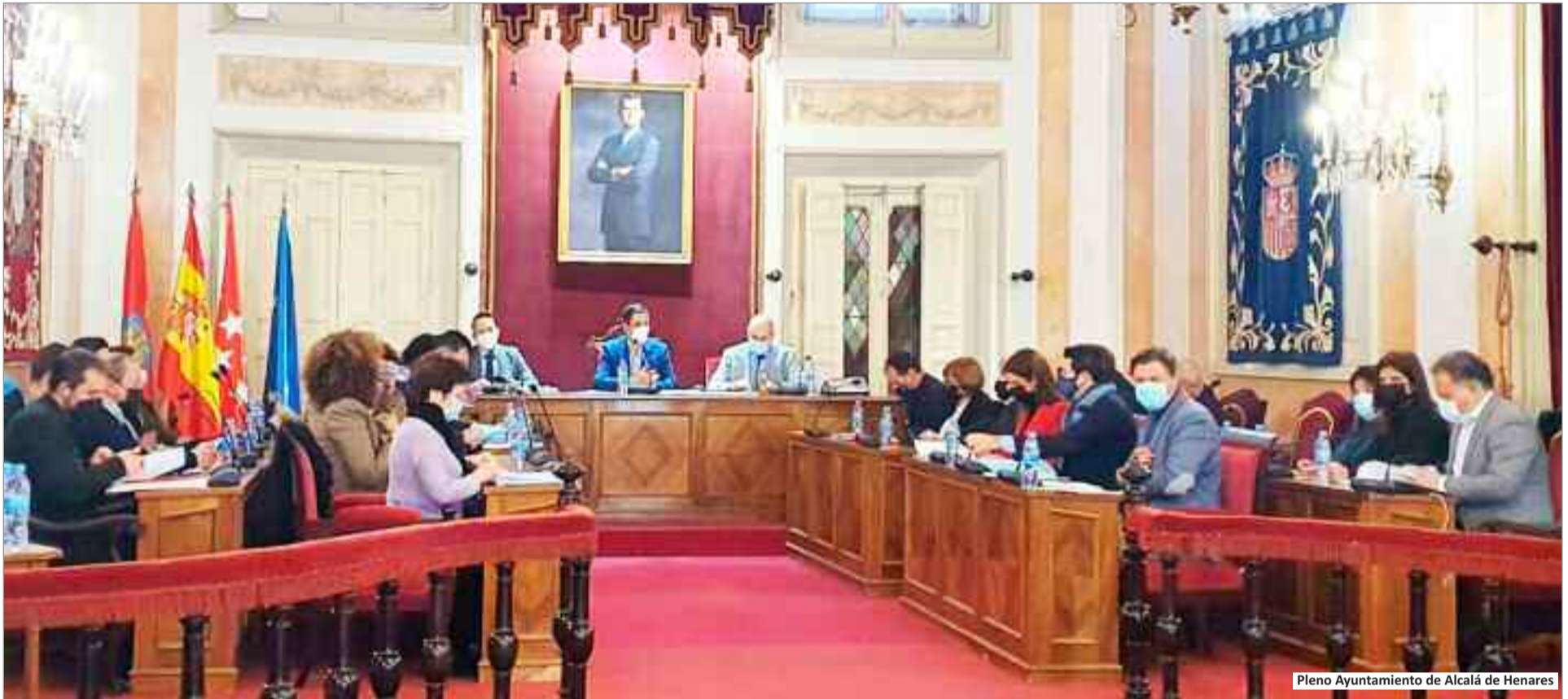
Pleno Ayuntamiento de Alcalá de Henares

Los presupuestos ascienden a 222 millones de euros, de los cuales 30 millones se destinarán a inversión