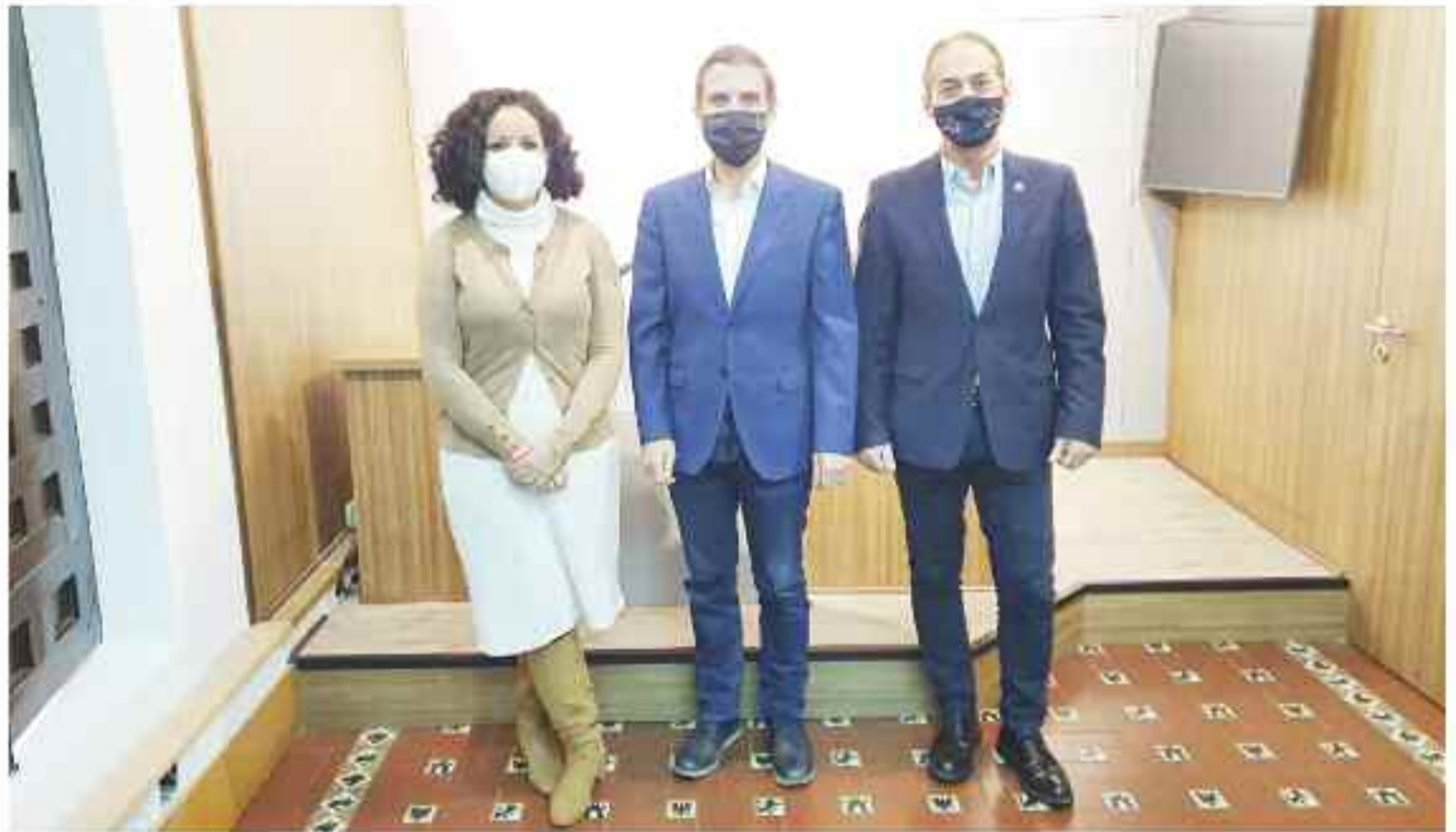
Diana Díez del Pozo, cuarta teniente de alcalde y concejala de Hacienda, Javier Rodríguez Palacios, alcalde de Alcalá de Henares y Miguel Ángel Lezcano, primer teniente de alcalde

San Antón volvió a reunir a los alcalainos en la calle mayor