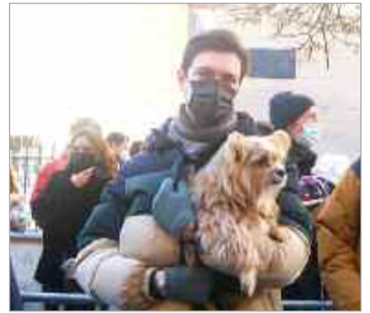
La bendición de animales frente al Hospitalillo de Antezana de la Calle Mayor se ha convertido ya en toda una tradición, un hecho específico de ello es la gran cantidad de devotos que procesionan frente al Santo para que sus mascotas reciban el agua y el panecillo bendecidos