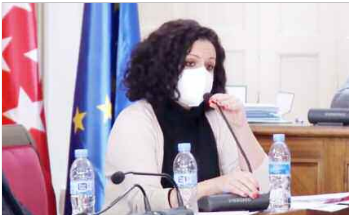
Diana Díaz del Pozo, cuarta teniente de alcalde y concejala de Hacienda del Ayuntamiento

La cuarta teniente de alcalde y concejala de Hacienda, Diana Díaz del Pozo, mostró su satisfacción por poder sacar adelante “unos presupuestos que suponen pasar de una inversión de 200.000€ en 2015 a los 30 millones actuales, con un Ayuntamiento bien gestionado, con la mayor inversión en medio ambiente de los últimos 15 años, pequeñas partidas pensadas para apoyar al tejido empresarial, y otras inversiones alejadas del populismo y que cambiarán la ciudad en el presente y en el futuro, para bien de toda la ciudadanía” .